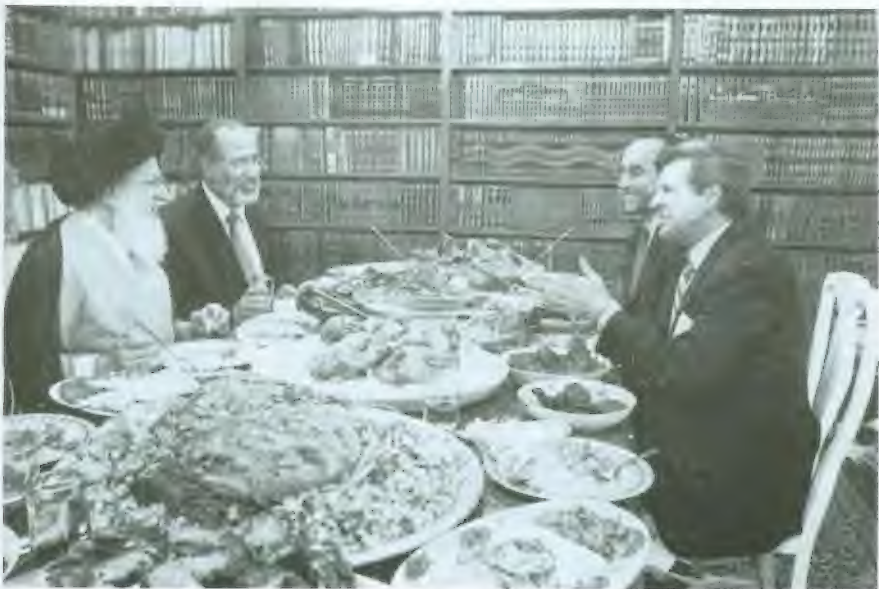
عشاء في منزل آية الله حسين الصدر (من اليسار إلى اليمين): آية الله الصدر، مستشار الأمن القومي العراقي موفق الربيعي، دان سينور، بريمر